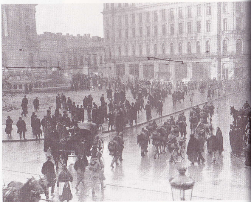
Soldați germani și civili pe Calea Victoriei, a doua zi după ocuparea Bucureștiului pe 23 noiembrie 1916.

Primul Război Mondial izbucnește în Europa în vara lui 1914, iar România intră în conflagrație alături de Antantă doi ani mai târziu, pe 27 august 1916. Pe 31 august, după calendarul cel nou, se naște la București cel de-al doilea copil al soților Djuvara, Neagu.