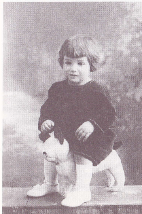
Neagu Djuvara copil.

Tata s-a temut ca mica sa familie să nu sufere din cauza foametei care amenința acest colț al țării, strâns între forțele Puterilor Centrale și Rusia, unde se instala, din ce în ce mai amenințător, haosul revoluționar. Prin urmare, a hotărât să-și trimită soția și cei doi copii în Franța, unde se afla tatăl său, ministru plenipotențiar al României la Bruxelles, retras, împreună cu întreaga Curte și cu guvernul belgian, la Le Havre.“